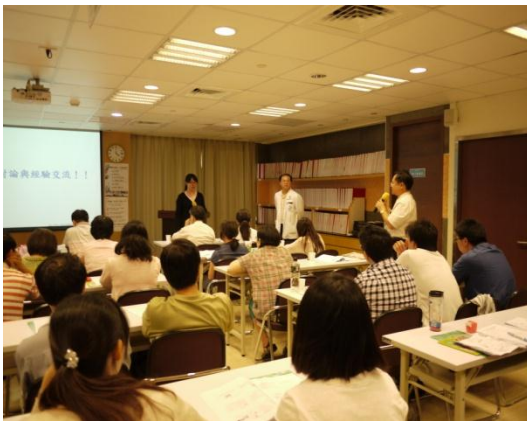
種子師資研習培訓