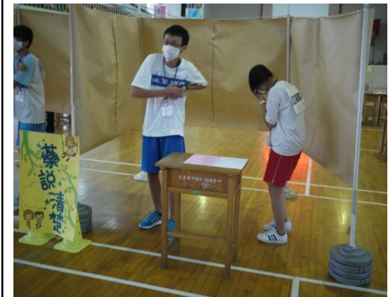
辦理正確用藥創意活動