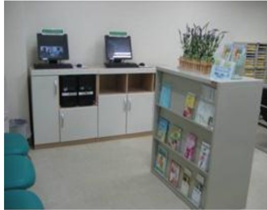
提供教材紙本及電子展示