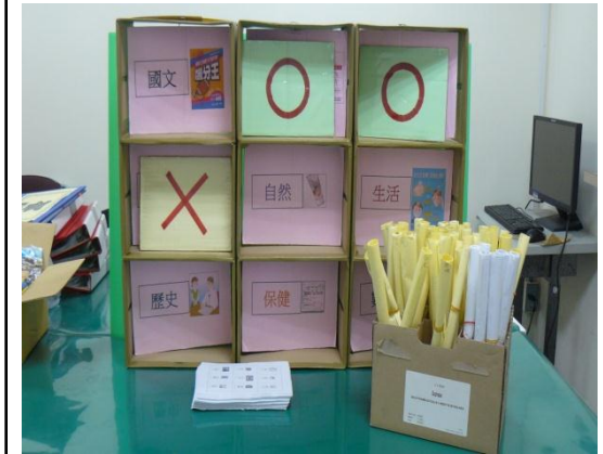
在地化教材或教具